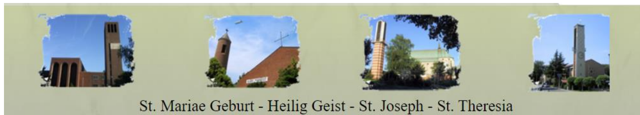
St. Mariae Geburt - Heilig Geist - St. Joseph - St. Theresia