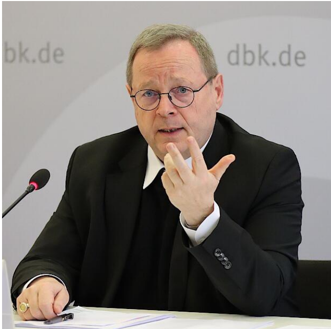
Der Vorsitzende der Deutschen Bischofskonferenz, Bischof Georg Bätzing, stellt Ergebnisse der Frühjahrstagung der Deutschen Bischofskonferenz vor.

Mit einem klaren Bekenntnis gegen völkisch-nationalistisches Denken, einem neuen Friedenswort und neuen Initiativen für mehr Synodalität in der katholischen Kirche in Deutschland ist die Frühjahrsvollversammlung der Deutschen Bischofskonferenz in Augsburg zu Ende gegangen.