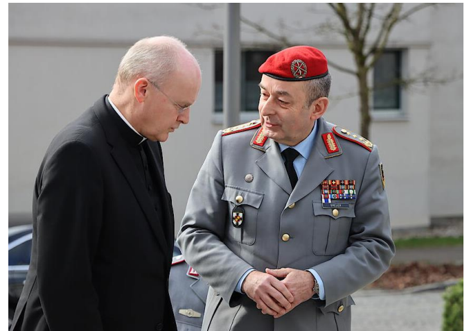
Ruhrbischof Franz-Josef Overbeck (links), der auch der katholische Militärbischof für die deutsche Bundeswehr ist, im Gespräch mit dem ranghöchsten deutschen Soldaten, Generalinspekteur Carsten Breuer.

Ein weiteres heikles Thema war die Friedensethik in Zeiten des Krieges. In einem über Jahre vorbereiteten Friedenswort bekennen sich die Bischöfe zur Aufrüstung der Bundeswehr und zur Waffenhilfe für die von Russland angegriffene Ukraine. Zugleich verweisen sie auf Grenzen des Selbstverteidigungsrechts, auch mit Blick auf das Vorgehen Israels im Gazastreifen. Ausdrücklich forderten sie das israelische Militär auf, aus humanitären Gründen derzeit von einer Einnahme von Rafah abzusehen.