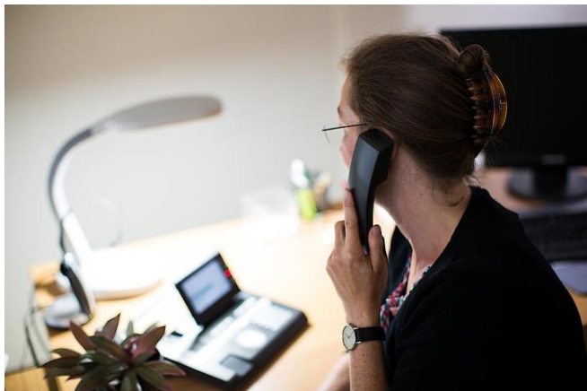
Die Telefonseelsorge lebt vom ehrenamtlichen Engagement.

Mehrere hundert Ehrenamtliche stehen in den vier Telefonseelsorge-Stellen im Bistum Essen bereit, um Tag und Nacht Menschen zuzuhören, die einsam sind, trauern oder aus anderen Gründen sehr stark belastet sind. Wer sich hier engagieren möchte, wird intensiv auf diese wichtige Aufgabe vorbereitet.