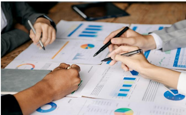
Das Bistum Essen verstärkt die Sicherung seiner finanziellen Basis.

Um trotz allgemeiner Kostensteigerungen und sinkender Kirchensteuereinnahmen auch in Zukunft weiter einen ausgeglichenen Haushalt zu erzielen – und damit handlungsfähig zu bleiben – muss das Bistum Essen bis 2038 schrittweise rund 50 Millionen Euro dauerhaft einsparen. Die nötigen Anpassungen beginnen bereits im kommenden Jahr und sollen alle Bereiche betreffen. Betriebsbedingte Kündigungen sind jedoch nicht geplant.